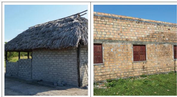
FIGURA 2 – Construções da Comunidade.

Sugeriu-se em reunião comunitária o desenvolvimento do projeto e, após ter sido aprovado pelos participantes, organizou-se um planejamento de estudos os quais envolvessem os estudantes em atividades que pudessem colocá-los em contato com informações reais, referentes às moradias locais que, além do adobe, são construídas em madeira ou tijolos comprados em olarias. A Figura 2 apresenta casas da Comunidade, uma construída com abobes (à esquerda) e outra, com tijolos, as quais foram tomadas como referência nos estudos realizados.