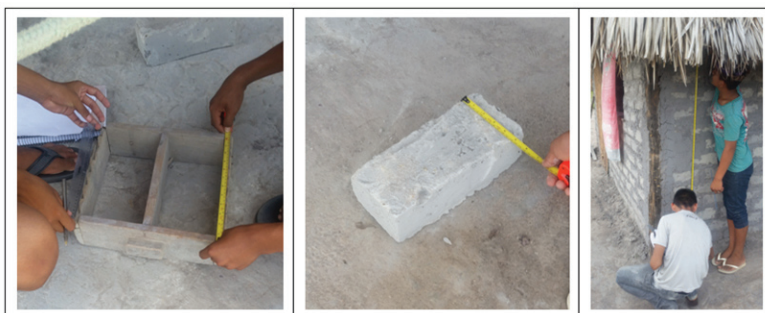
FIGURA 3 – Estudantes realizando medições.

Na sequência dos trabalhos, os estudantes tiveram a oportunidade de medir, fazer comparações e estabelecer relações entre as diferentes construções da Comunidade. A Figura 3 destaca os estudantes no trabalho de campo.