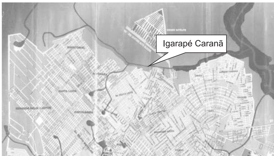
FIGURA 1 – Mapa da Bacia Hidrográfica do Igarapé Caranã e sua distribuição em relação aos bairros.

Leite, Jardim primavera, Piscicultura, União, e Jardim Caranã. Na margem esquerda, localiza-se o mais novo loteamento, Bairro Cidade Satélite.