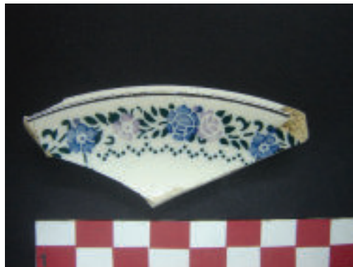
Figuras 4 - Detalhe das técnicas Transfer Printing e Estêncil .