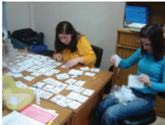
Figuras 3 - Análise dos fragmentos de louças.

Posteriormente foram elaboradas fichas de identificação para as peças, nas quais deveriam constar todas as informações, além do tipo de peça que se formava, tais como malga, xícara, pires, prato, etc. Através dessas análises, foi possível identificar suas decorações, períodos de fabricação e até mesmo as marcas dos fabricantes e país de origem.