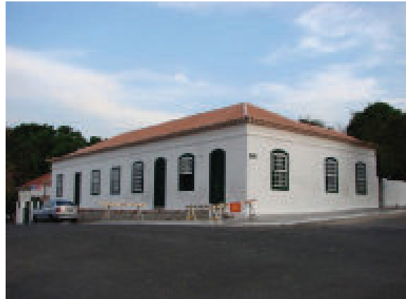
Figuras 1 - Fachada da Casa Gomes Jardim antes e depois das obras do restauro.

Gomes Jardim viveu entre 1783 a 1854, era considerado médico prático, sem formação acadêmica, mas usava de seus conhecimentos homeopáticos para tratar os doentes. Foi um personagem de destaque da Revolução Farroupilha (1835-1845) e o primeiro presidente da República Rio-Grandense. Ele assumiu o lugar de Bento Gonçalves, quando o líder esteve preso na Bahia, e organizou a primeira tropa de soldados para invadir Porto Alegre.