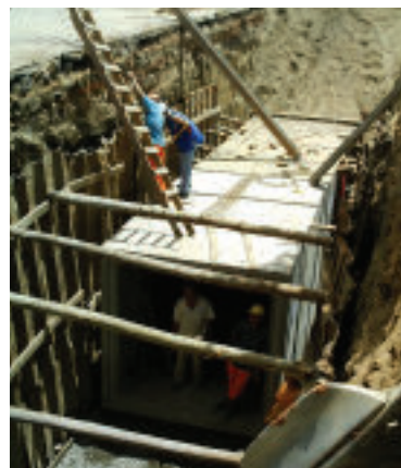
Figuras 2 - Monitoramento arqueológico das obras do Conduto Forçado.

O objetivo deste trabalho consiste em analisar e comparar as diversas evidências encontradas durante a realização das intervenções que ocorreram nos dois locais e na apresentação dos resultados parciais da análise das louças. Essas evidências materiais permitem identificar os diferentes hábitos e costumes da população que viveu em Porto Alegre, durante os séculos XIX e XX.