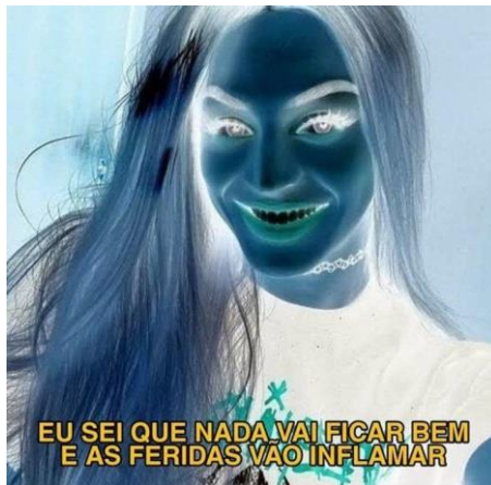
Figura 6 - Meme invertido