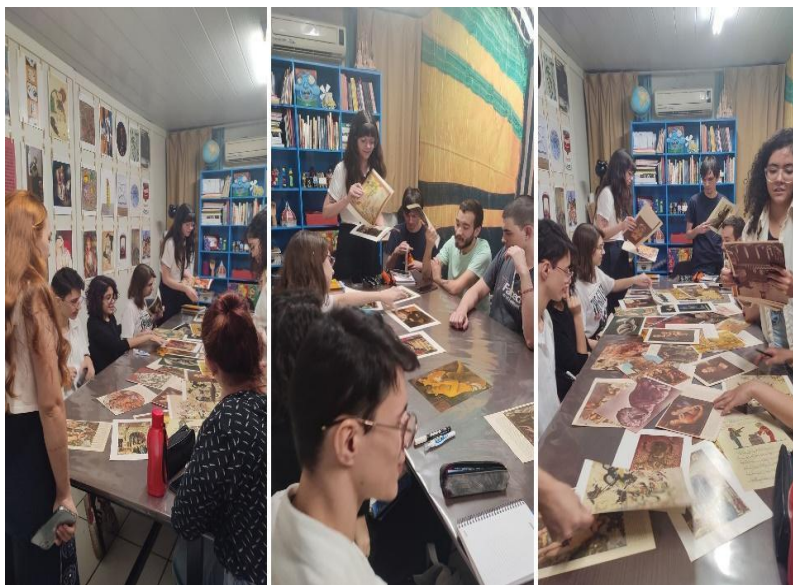
Figura 10 - Registros da primeira Oficina de criação de memes analógicos.

Assim, inspirados pelo trabalho artístico de Jaider Esbell e tendo em vista as experiências empíricas que tivemos com a criação da série historiadaarte.exe (2024) e as reflexões científicas levantadas pelos autores e autoras supracitados, organizamos, duas Oficinas de criação de memes analógicos . As atividades, organizadas e oferecidas como eventos de extensão em 2024, estiveram vinculadas à Universidade Estadual de Maringá e ao Grupo de Pesquisa em Arte Educação e Imagens (ARTEI) e aconteceram em dois formatos distintos. A primeira Oficina de criação de memes (Figura 10) envolveu a consolidação de um grupo e encontros periódicos, quando debatemos sobre a já mencionada obra Carta ao Velho Mundo (2019), de Jaider Esbell, assim como expomos resultados parciais da análise de memes, aqui apresentada de modo concluído e sistematizado.