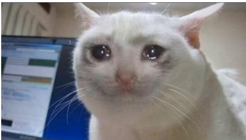
Figura 5 - Meme do gato chorando