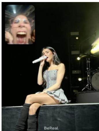
Figura 7 - Meme Madison Beer

Fonte: https://knowyourmeme.com/memes/fan-screaming-at-madison-beer-performance-bereal . Acesso em 20 de junho de 2024.