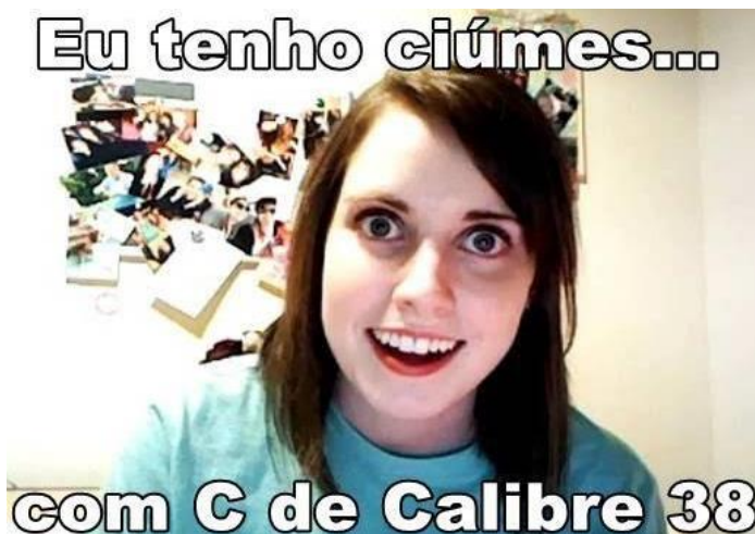
Figura 4 - Meme Namorada Obsessiva -

Fonte: https://museudememes.com.br/collection/namorada-sinistra . Acesso em 20 de junho de 2024.