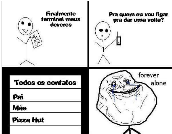
Figura 2 - Meme forever alone