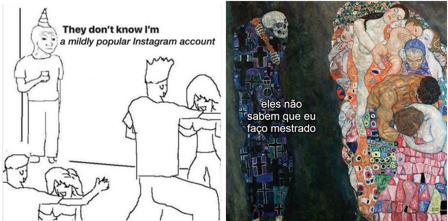
Figura 9 - Meme they don't know e Meme com apropriação da obra Morte e vida, de Gustav Klimt (2024)