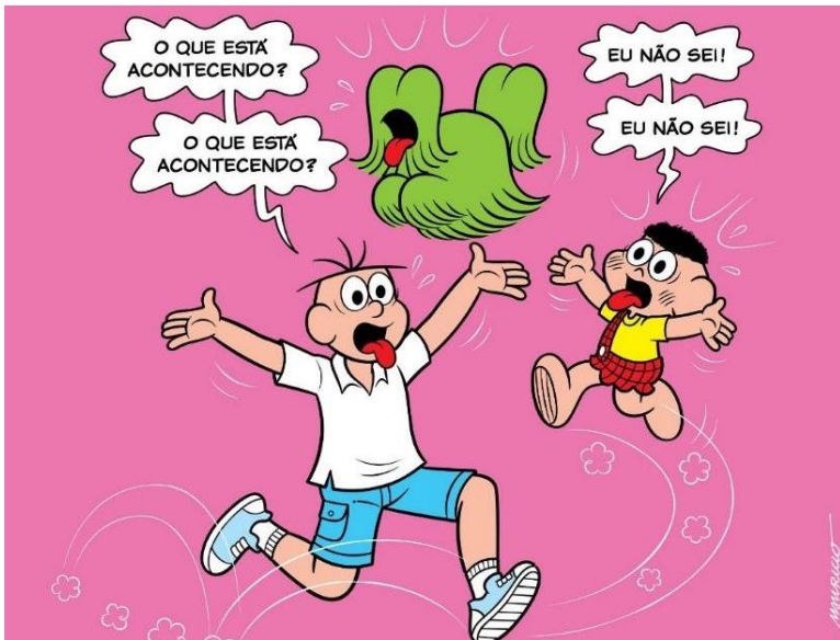
Figura 3 – Meme o que está acontecendo?