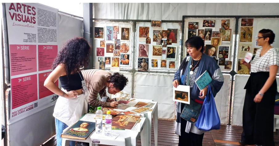
Figura 11 – Estande do curso de Artes Visuais na Mostra de Profissões da UEM, com o painel de memes analógicos -